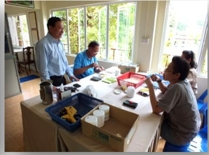
จิตอาสาบัณฑิตยา