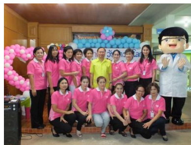
รณรงค์ล้างมือ