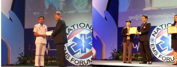
ได้รับรางวัลชนะเลิศโครงการ EMS ระบบสื่อสารฉุกเฉินศูนย์สั่งการระดับประเทศ