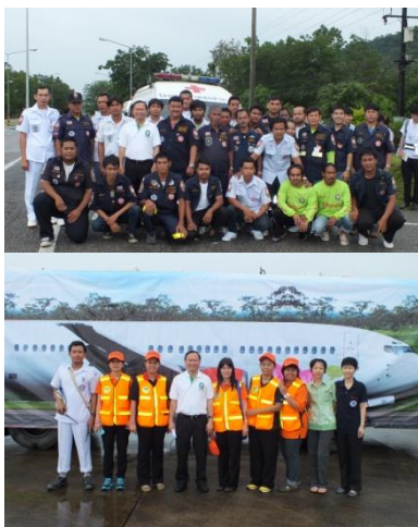
ร่วมฝึกซ้อมแผนฉุกเฉินที่สนามบิน