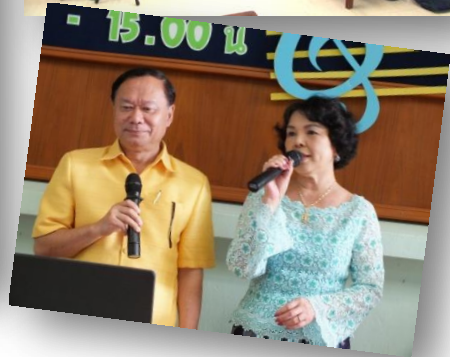
จิตอาสาพาเพลิน