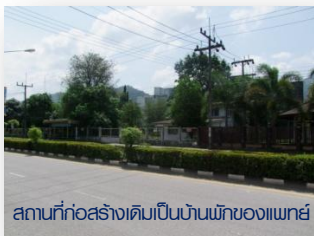
สถานที่ก่อสร้างเดิมเป็นบ้านพักของแพทย์