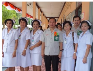
หน่วยแพทย์ พอ.สว.