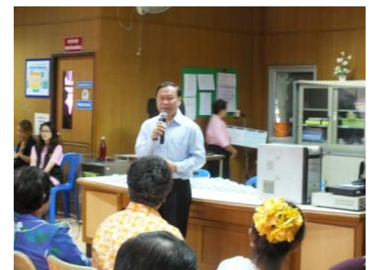
ผู้อำนวยการพบผู้ป่วยโรคเบาหวาน