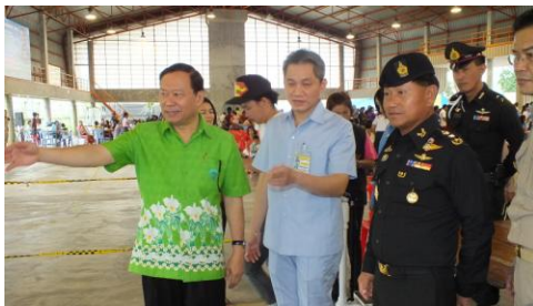
โครงการตรวจสุขภาพ One Stop Service