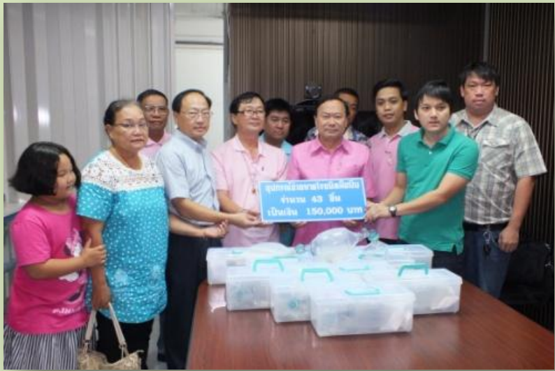
ชมรมพระเครื่องจังหวัดระนอง มอบทุนสร้างหอพระ: 150,000 บาท

มูลนิธิระนองสงเคราะห์ จังหวัดระนอง บริจาค เสื้อผ้า และผ้าทอมให้กับผู้ป่วย มูลค่า 457,544 บาท