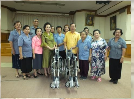
ชมรมผู้สูงอายุ สว.ระนอง

มูลนิธิระนองสงเคราะห์ จังหวัดระนอง บริจาค เสื้อผ้า และผ้าทอมให้กับผู้ป่วย มูลค่า 457,544 บาท