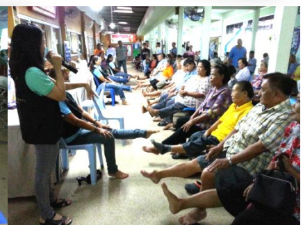
จิตอาสาพาออกกำลังกาย