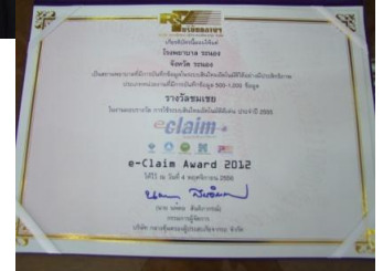
ได้รับรางวัลชมเชย e-Claim Award 2012