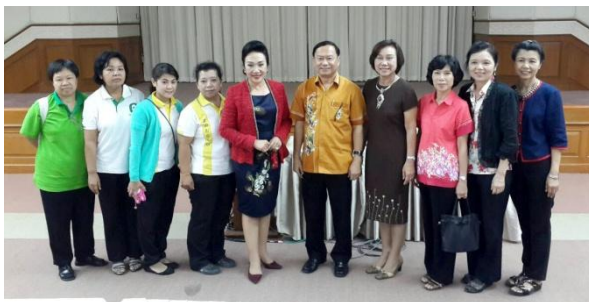
อบรมพัฒนาบุคลากรให้บริการ